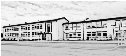
Münchhofschule Grundschule Kreuzhohlstr. 2 67691 Hochspeyer